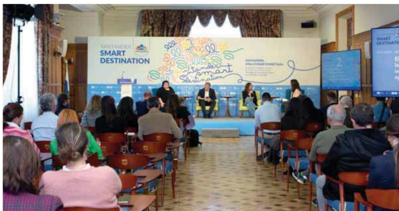
Un momento del encuentro en torno a la Plataforma Inteligente de Destinos celebrado en la capital cántabra.

La sensorización y la implementación de gemelos digitales permiten geolocalizar flujos de visitantes y predecir escenarios